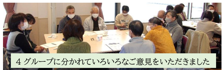
4グループに分かれていろいろなご意見をいただきました