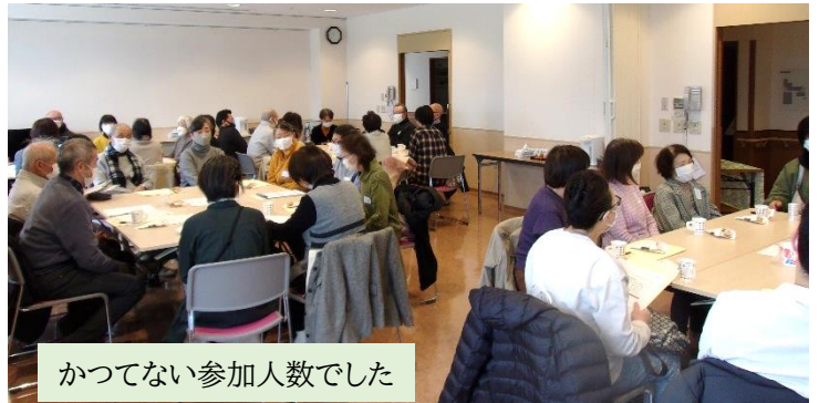
かつてない参加人数でした