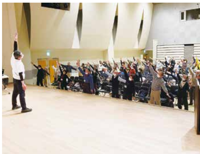
95人が参加した保健委員研修交流集会