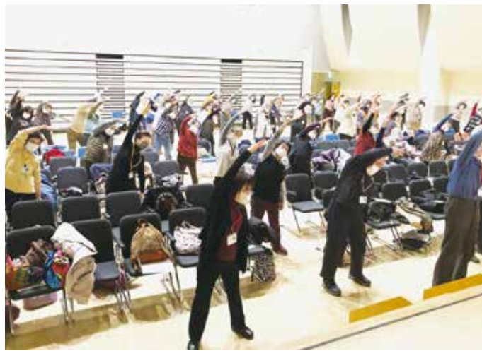
リズム体操を参加者全員で