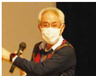
神立坂井輪総支部長