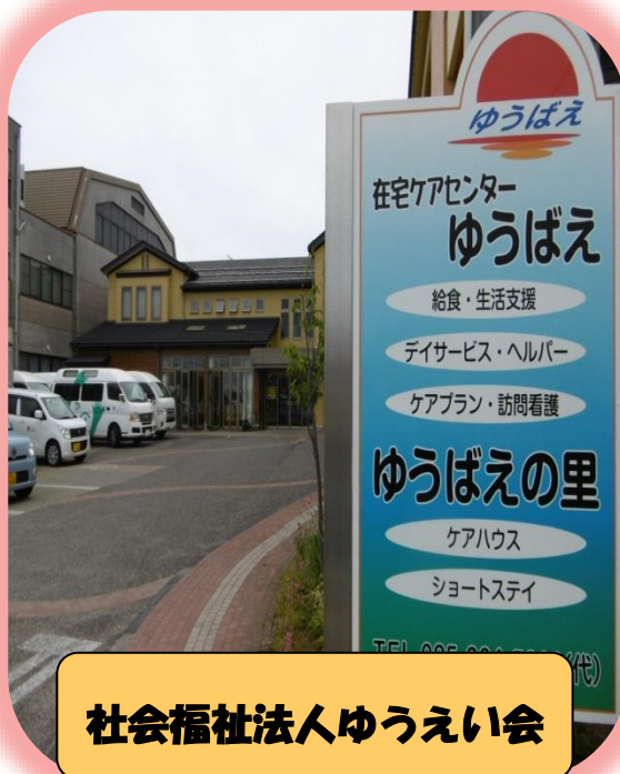
社会福祉法人ゆうえい会