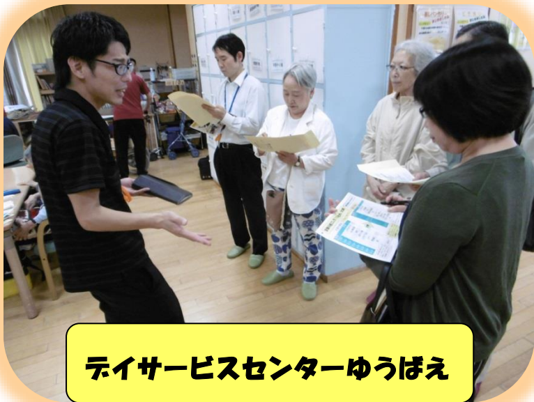
デイサービスセンターゆうばえ

『認知症の人と家族の会』の方々が施設見学へ来られ、当法人管理者より各施設説明を行いました。