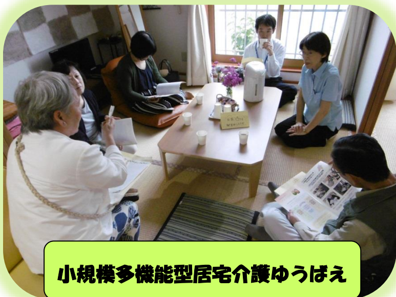
小規模多機能型居宅介護ゆうばえ

「認知症があっても安心して暮らせる社会」の実現を目指して、当法人としても認知症の方への対応、ご家族の方への相談・支援等、より一層尽力して参ります。