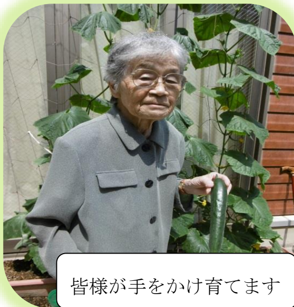
皆様が手をかけ育てます