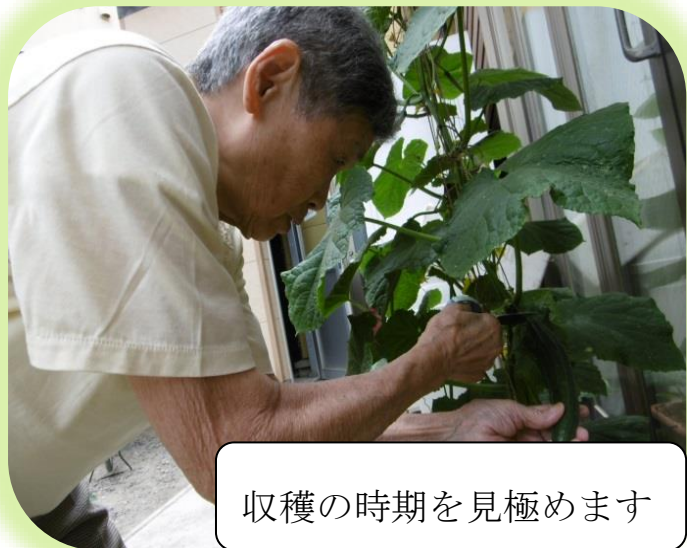
収穫の時期を見極めます