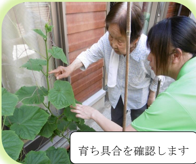
育ち具合を確認します