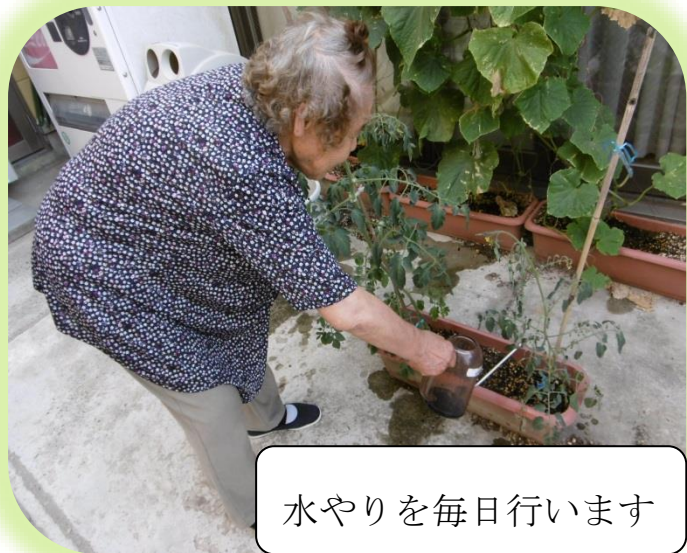
水やりを毎日行います

ゆうばえでは『自立支援』へ向けた取り組みの一つとして「園芸療法」を行なっております。植物を育てる事は五感を刺激し、認知症予防にも効果があるとされており、サービスの一環として取り入れております。