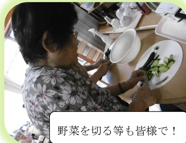
野菜を切る等も皆様で！