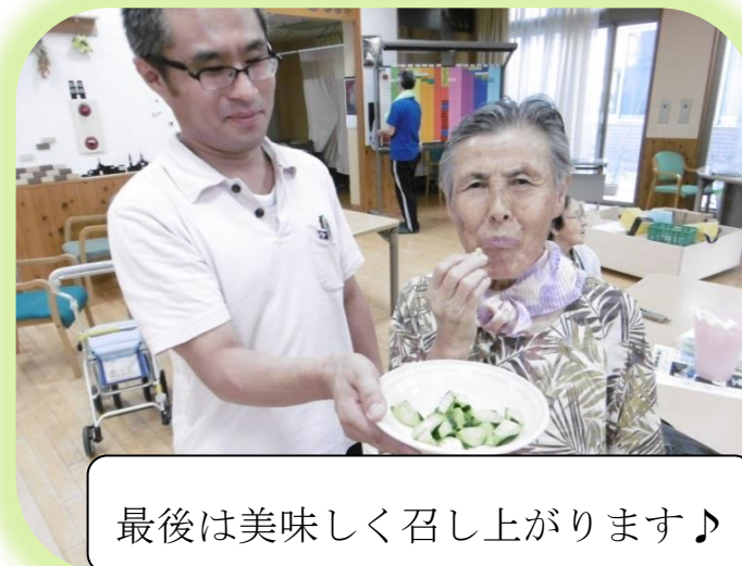
最後は美味しく召し上がります♪