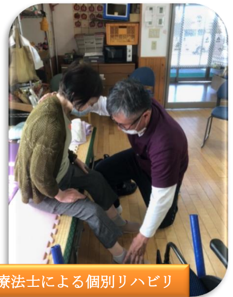
理学療法士による個別リハビリ