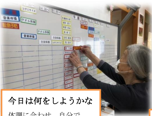
今日は何をしようかな 体調に合わせて、自分で 一日の活動を選びます。