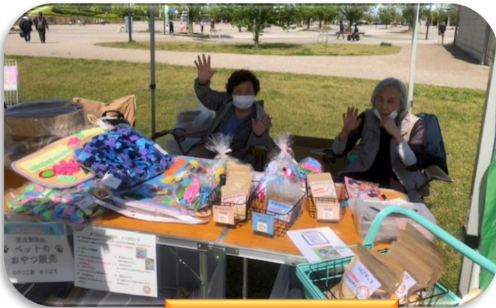
イベントでの販売活動