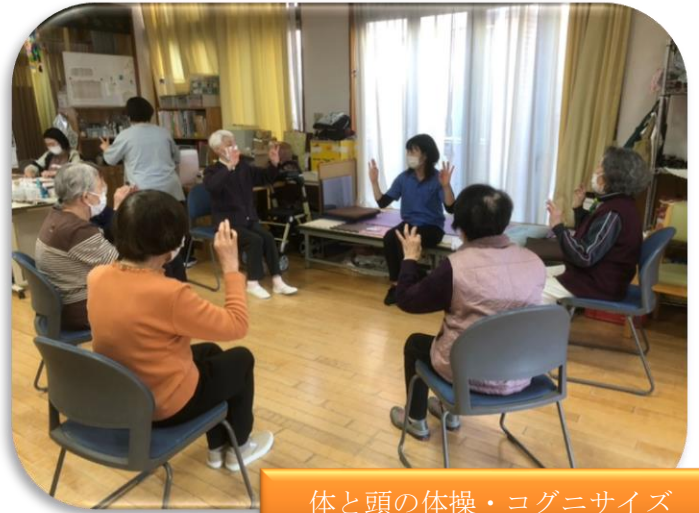
体と頭の体操・コグニサイズ