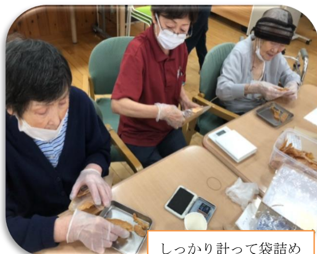
しっかり計って袋詰め