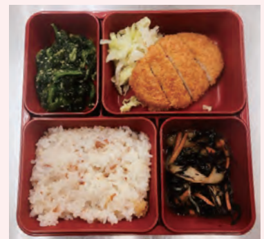
梅おこわ/トンカツ/ひじき煮/ホウレンソウ胡麻和え