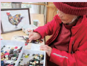
様々な種類のボタンを製作者のセンスで貼り付けていきます。

「えんでこ」には、畑の先生、漬物の先生、DIYの先生、手芸の先生、絵手紙の先生などなど、特技をお持ちのメイトさんがたくさんいます。そんなメイトさん達の力をお借りし、いずれは地域の方たちも一緒に、趣味の活動を定期的に開催できたらと、思っています。