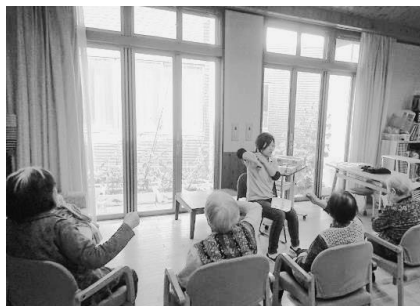
デイサービス：少人数の健康体操