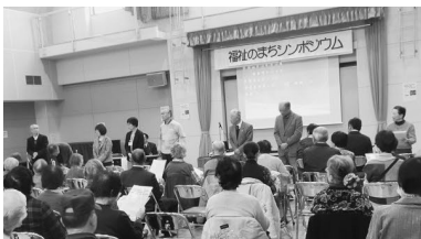
感想をお話するシンポ呼びかけ人の皆さん