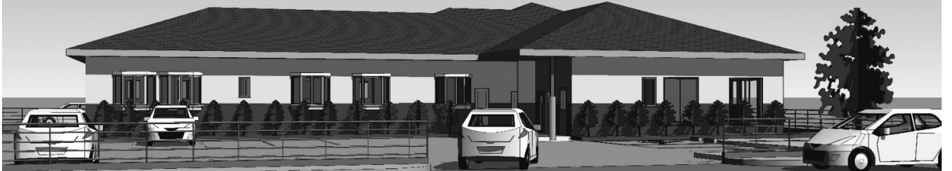
グループホームゆうばえ (仮称) 完成イメージ図