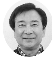
日本カーリンコン協会 会長