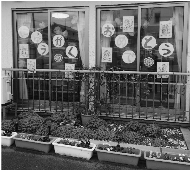
小規模多機能ホームゆうばえの家から、西内野小学校新入生にエールが送られました。 学校に慣れたら、ゆうばえの家に遊びに来てくださいね！