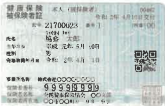
健康保険証のイメージ