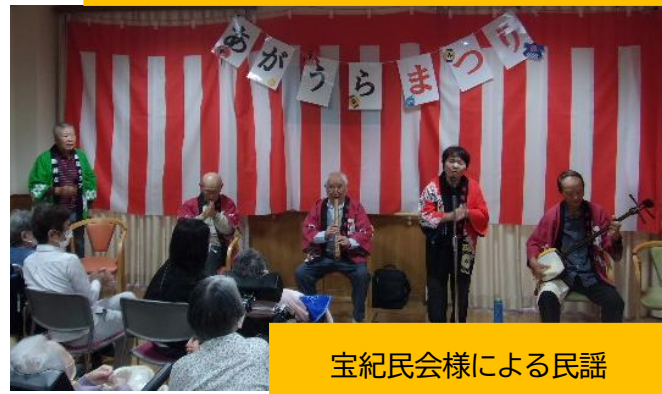
宝紀民会様による民謡