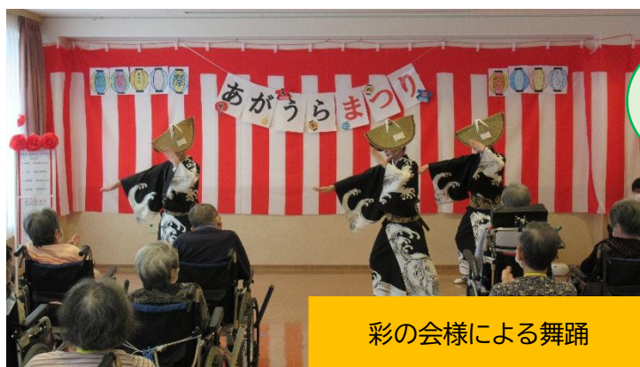
彩の会様による舞踊