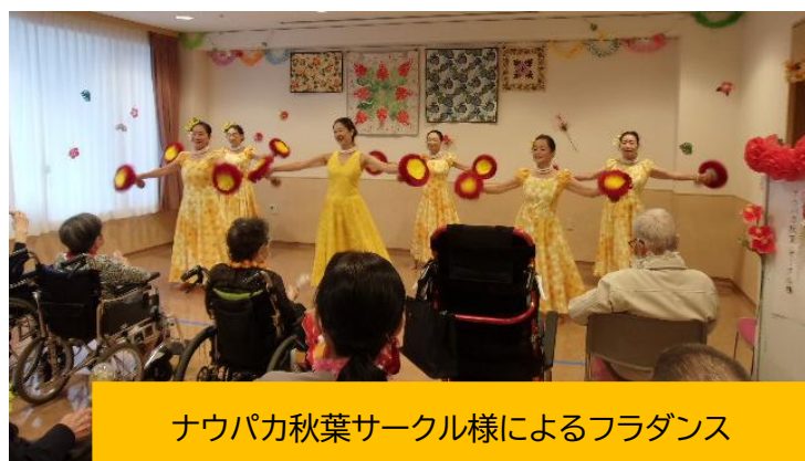
ナウパカ秋葉サークル様によるフラダンス