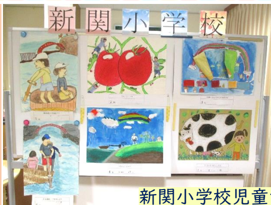
新関小学校児童さんの作品

特養あがうらでは、11月4日から12月1日まで1階ロビーにて文化祭を開催しました。各ユニットや入居者様、職員、近隣小学校の児童さんたちの力作が並びました。作品を見た方々は「上手だね〜!」と感動されていました。