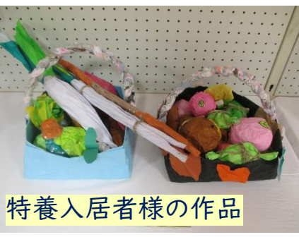
特養入居者様の作品