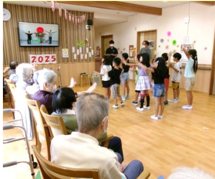
7/28 キッズクラブダンス発表会