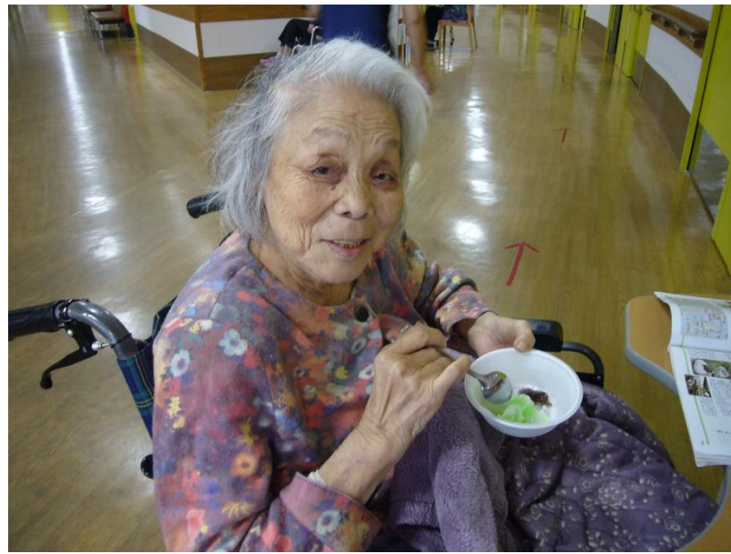
かき氷を美味しく♪ 余暇の楽しみですね～!

こちら、有志職員によるレクリエーションを展開しているようです◎ 余暇の時間、何をしているのでしょうか…!? ほら、この笑顔が「楽しい」を物語っていますね!!