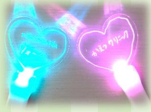
病院まつりのインスタ映えブースイメージ