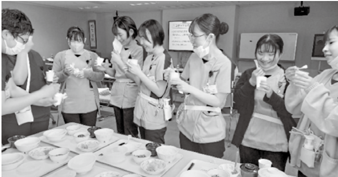
嚥下調整食の試食をしています

毎年4月に下越病院では10数人の新人看護師を受け入れています。最近では学生のうちに経験できる技術は限られており、採血や注射などは看護師になってから初めて体験するというケースも少なくありません。また、コロナ禍で実習に行く機会が少なくなり、現場に出た時のギャップ(リアリティショックと呼ばれる)に衝撃を受けると新人看護師もいます。 そこで、当院では4月の間は、机上研修を中心に研修を行い、まずは知識と技術の習得を目指します。そして配属部署に行って先輩看護師の見守りのもと、実践する...というように、ちよつとずつ慣れていくような研修プログラムを作っています。急に現場で実践!でないと不安が少なかつたで「先輩が見守ってくれるので安心」と新人看護師。講師は看護師だけでなく、医師・薬剤師・検査技師などたくさん職種のみなさんが協力してくれま また、昨年度からはピ