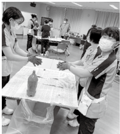
感染予防の実技研修中!

毎年4月に下越病院では10数人の新人看護師を受け入れています。最近では学生のうちに経験できる技術は限られており、採血や注射などは看護師になってから初めて体験するというケースも少なくありません。また、コロナ禍で実習に行く機会が少なくなり、現場に出た時のギャップ(リアリティショックと呼ばれる)に衝撃を受けると新人看護師もいます。 そこで、当院では4月の間は、机上研修を中心に研修を行い、まずは知識と技術の習得を目指します。そして配属部署に行って先輩看護師の見守りのもと、実践する...というように、ちよつとずつ慣れていくような研修プログラムを作っています。急に現場で実践!でないと不安が少なかつたで「先輩が見守ってくれるので安心」と新人看護師。講師は看護師だけでなく、医師・薬剤師・検査技師などたくさん職種のみなさんが協力してくれま また、昨年度からはピ