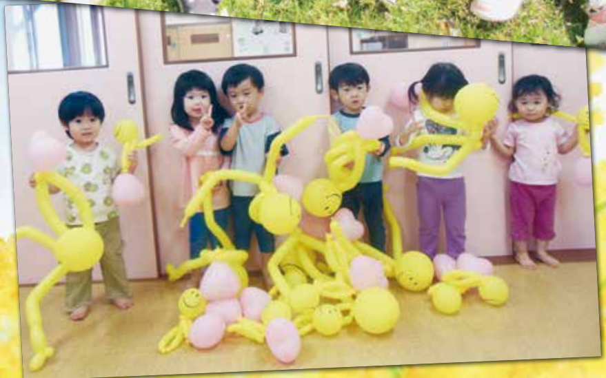
たんぼぼ保育園の園児