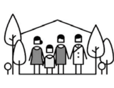
家族・生活背景まで診る