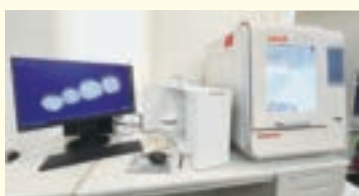
写真左側がコンピューターによる設計支援(CAD)と、右側がコンピューターによる製造支援(CAM)

CAD/CAMシステムを導入した、かえつ歯科にご期待ください。また、お口のことでお困りになりましたら、かえつ歯科にご相談ください。