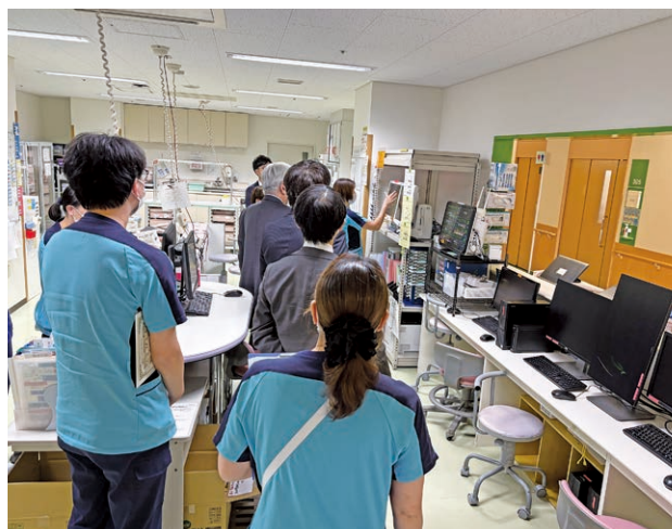
病棟ラウンドの様子