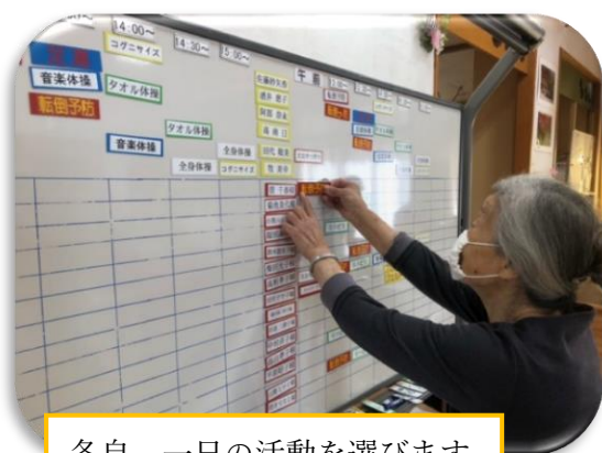
各自、一日の活動を選びます