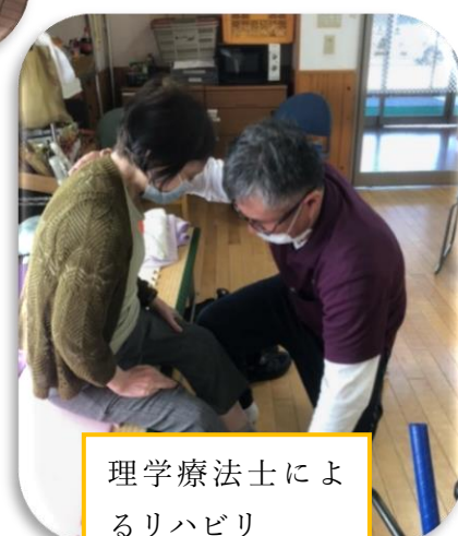
理学療法士によるリハビリ