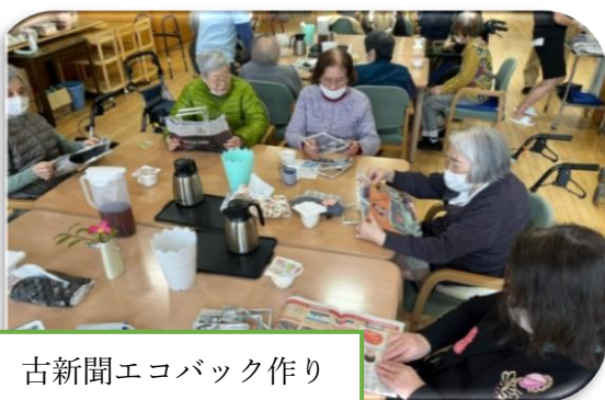
古新聞エコバック作り