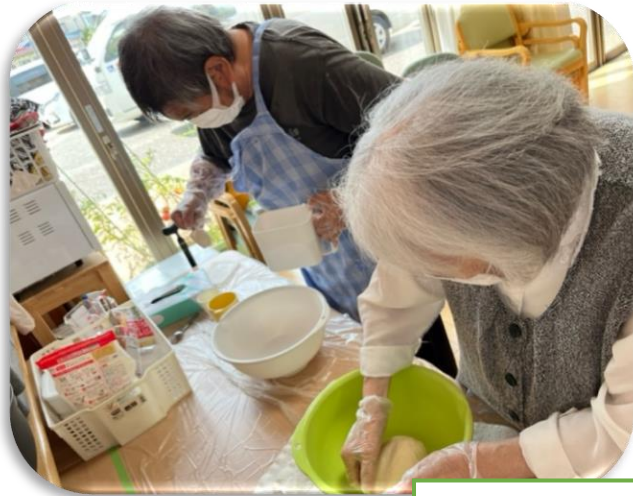
パン作り、調理活動はリハビリ！