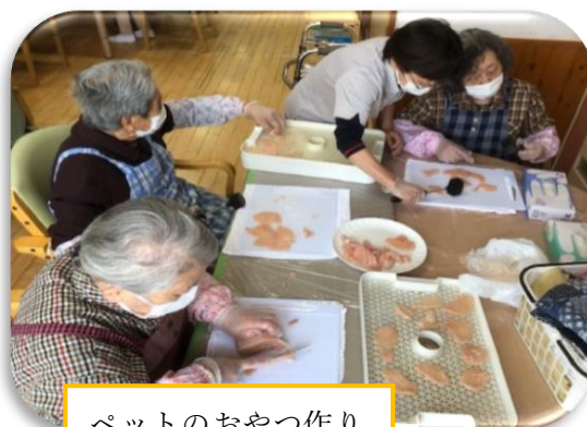
ペットのおやつ作り