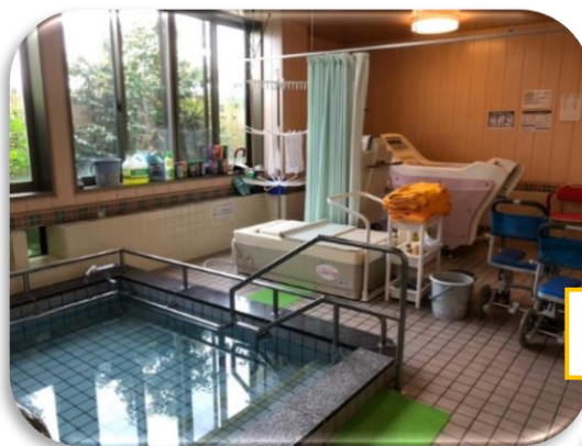
明るく安心な浴室