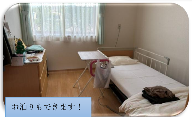
お泊りもできます！