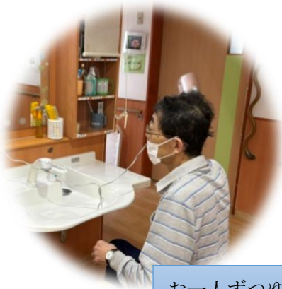
お一人ずつゆっくり入浴

午前中は、体操、お風呂の順番を待つ間の物づくりなど軽作業。お天気のよい午後には、散歩や外でのお茶会。ご自宅で過ごす方へは訪問し、バイタルチェックや内服確認、配食やゴミ出し、掃除などを支援しています。